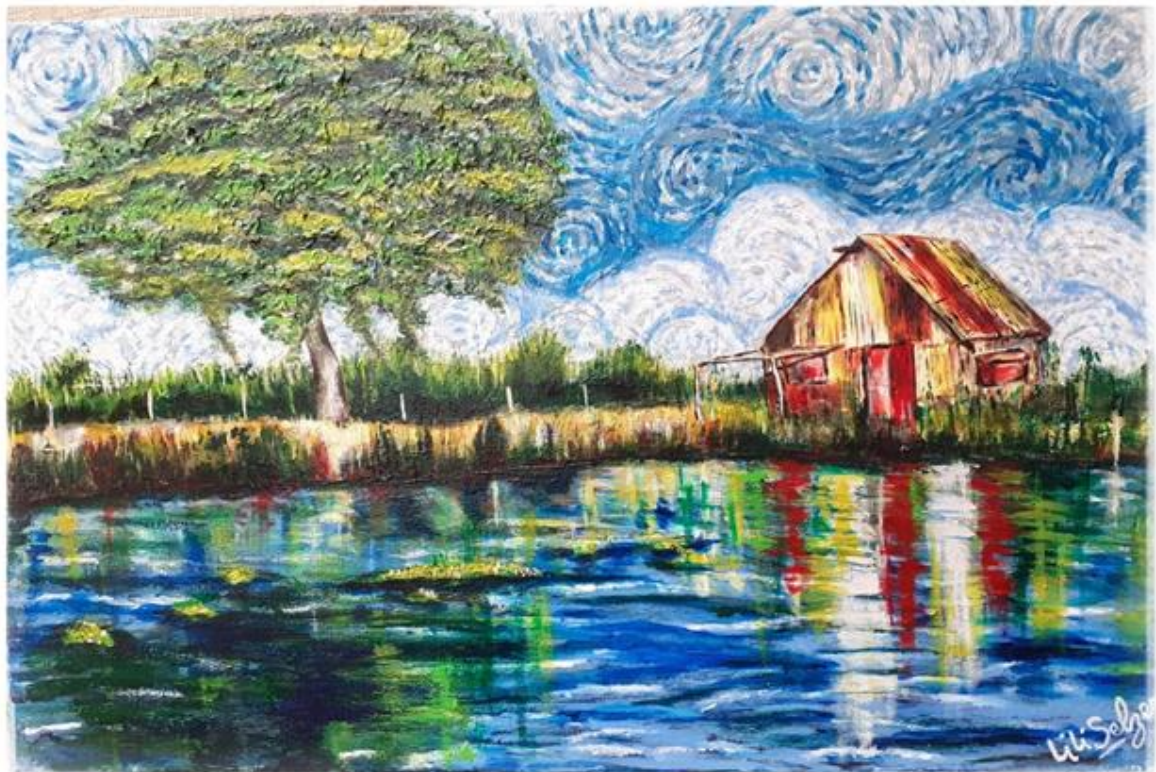
Obra: "RANCHO DE LOS PESCADORES" Julio 2020 Autor: Liliana Mabel Selzer