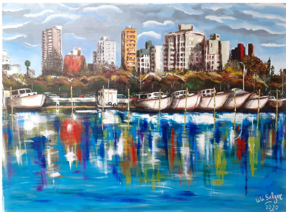
Obra: “Náutica Costanera VIEJA” Julio 2020