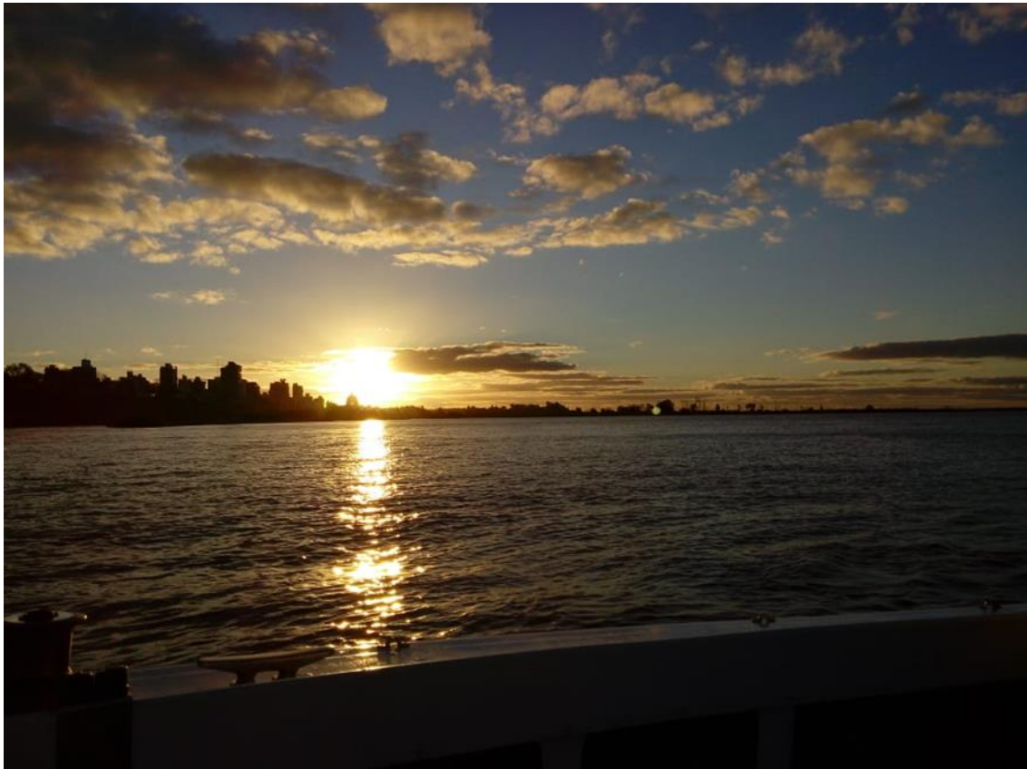
Imagen: colección Marcela Longinotti 2