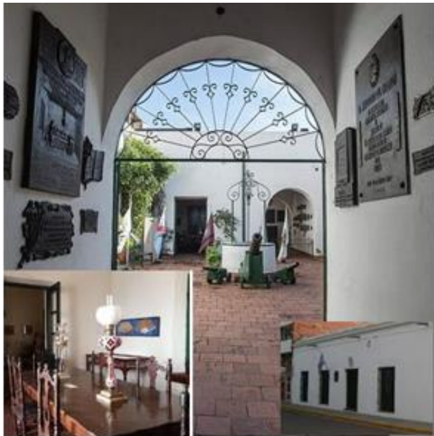
Casa del Acuerdo